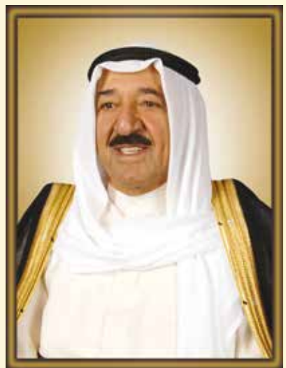
سبحان الله فهد بن عبدالعزيز آل سعود ولي عهد المملكة العربية السعودية