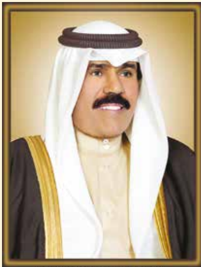
سبحان الله نواف بن فهد آل سعود ملك المملكة العربية السعودية