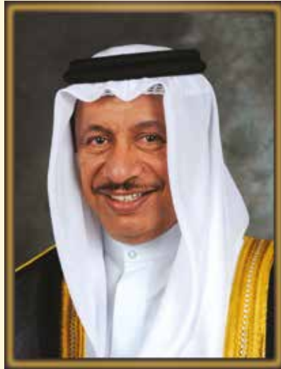
سمو الشيخ جابر المبارك الحمد الصباح