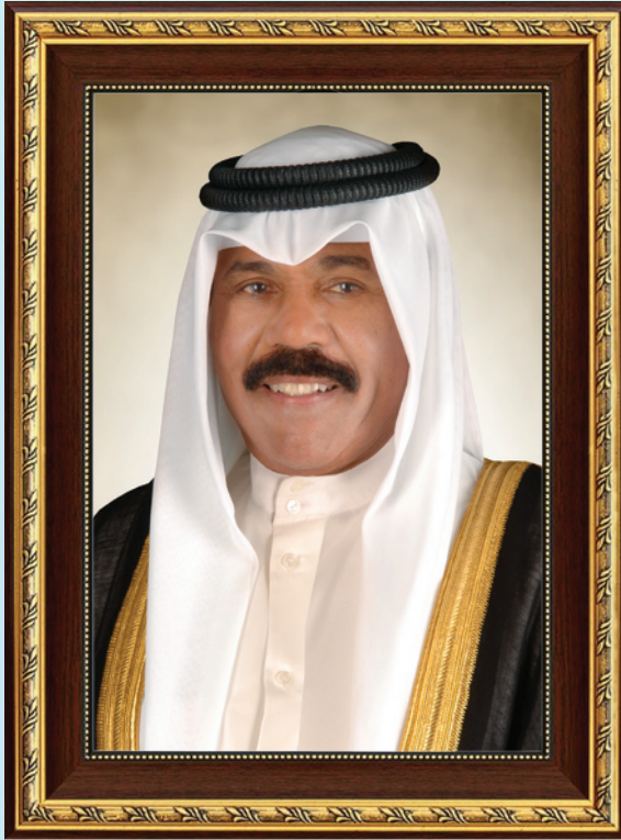
حضرة صاحب السمو الشيخ نواف الأحمد الجابر الصباح أمير دولة الكويت

H.H. Sheikh Nawaf AL-Ahmad Al-Jaber Al-Sabah The Amir Of The State Of Kuwait