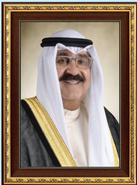
سمو الشيخ مشعل الأحمد الجابر الصباح ولي عهد دولة الكويت

H.H. Sheikh Meshal AL-Ahmad Al-Jaber Al-Sabah The Crown Prince Of The State Of Kuwait